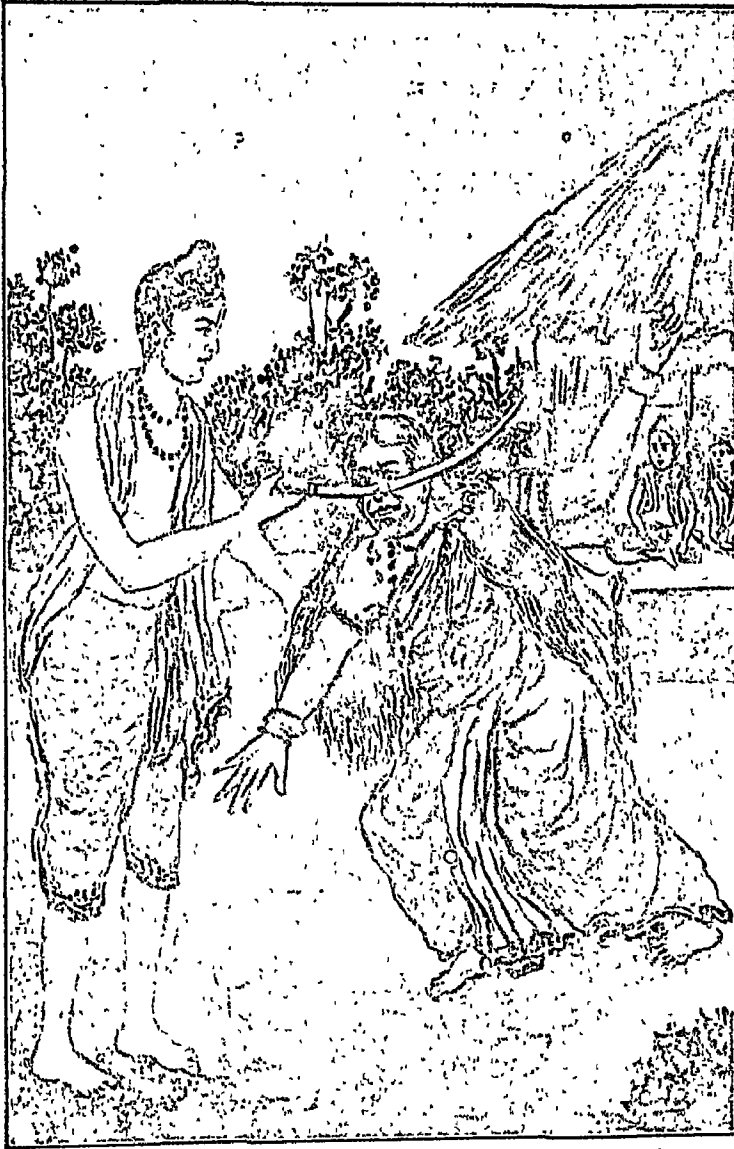
शूर्पनखा को नाक काटी जाती है